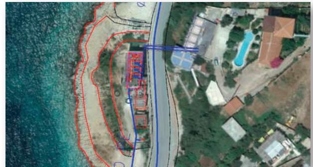
Pamje nga sipër e Stacionit të Pompimit 6 - Rehabilitimi i digës mbrojtëse nga uji i detit

Ndikimi kryesor: Furnizimi me ujë 24/7 për mbi 95,000 banorë