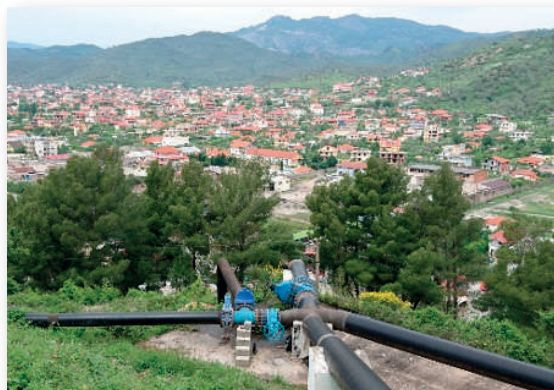
Rezervuari Krasta e Madhe

Ndikimi kryesor: përmirësimi i furnizit me ujë -sistem i ri i kontrollit - puse të sigurta