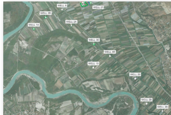
Fusha e pusçpimit Karafaj - Rehabilitimi i 4 puseve ekzistuese dhe shpimi për ndërtimin e 3 deri në 4 puseve të reja

Ndikimi kryesor: rrjeti i përmirësuar i ujësjellësit dhe sistemit të kontrollit - ujë i mjaftueshëm në dispozicion 24/7/365